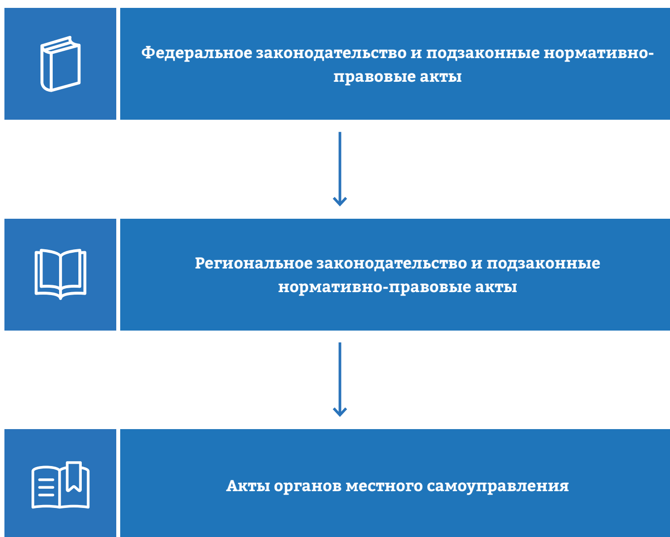
Рисунок 1 – СТРУКТУРА ПРАВОВОГО РЕГУЛИРОВАНИЯ КАПИТАЛЬНОГО РЕМОНТА

Структура такой системы выглядит следующим образом: