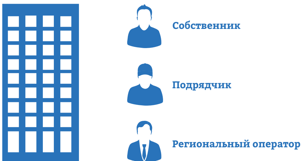
Рисунок 4 – СТОРОНЫ, УЧАСТВУЮЩИЕ В ПРИЕМКЕ РАБОТ

Сторона подрядчика: сам подрядчик и специалисты по строительному контролю, нанятые подрядчиком, заинтересованы в скорейшем принятии работ при любом качестве исполнения. От того, насколько быстро примут работу, зависит оплата вознаграждения подрядчику и отсутствие штрафных санкций, в случае если в договоре с региональным оператором такие штрафные санкции указаны за несвоевременно